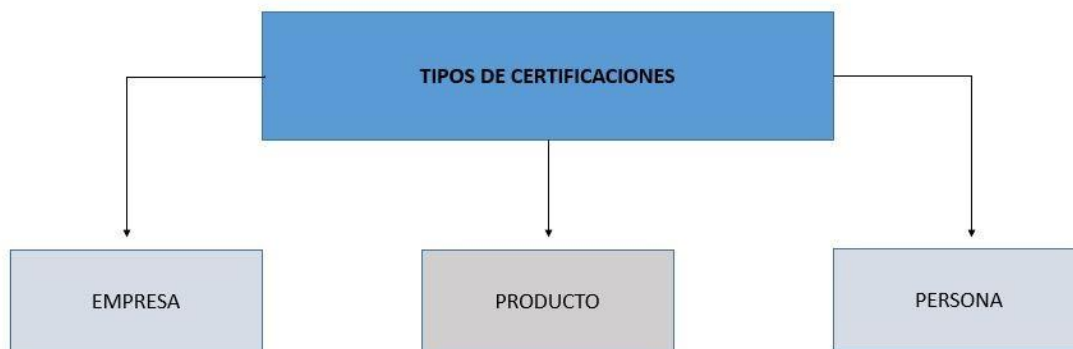
Figura 2. Tipos de certificaciones

Para poder clasificar las certificaciones en diferentes grupos de acción se precisa entender los escenarios en los cuales estas pueden ser usadas. Debido a los múltiples de campos de acción y necesidades que pueden cubrir las certificaciones ha sido importante denominar tres grandes grupos en los cuales se pueden clasificar las certificaciones. En primer lugar, se reconoce que las certificaciones otorgadas a los establecimientos. Allí se evalúan infraestructura y procesos internos y externos de la empresa. Seguido a esto, están las certificaciones a los productos; con esto se busca vigilar la calidad y seguridad tanto materiales como de los productos y servicios. Finalmente, se ubican las certificaciones de personas. En este apartado se certifican todas esas competencias que puede adquirir una persona para el desarrollo de cualquier actividad (Chamorro, Miranda, & Rubio, 2004).